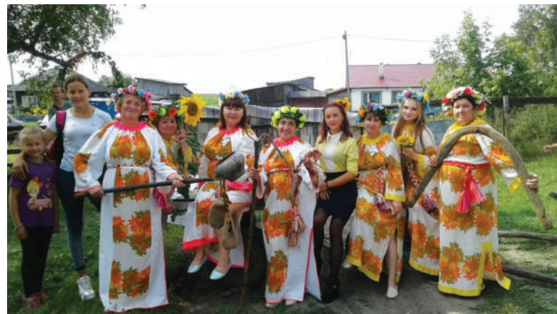
Праздник Дня национальных культур на площадке Якшинского клуба

Однако вездесущий коронавирус нарушил грандиозную программу под названием «Путешествие в лето». Ограничения, самоизоляция, маски. И связанные с этим «нельзя, нельзя, нельзя...» изрядно подпортили ребятам привычные летние яркие впечатления. Да и как может выдержать детская впечатлительная душа все нахлынувшие на нее неприятности! Сколько бы усилий не приложили взрослые, какие бы придумки не предлагали для того, чтобы по возможности скрасить времяпровождение своих деток, сделать сполна этого не удалось.